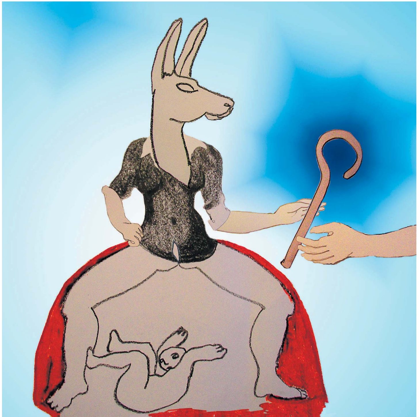
ILLUSTRATIE IRIS KIEWIET

De huidige generatie hoogopgeleide vrouwen zadelt de komende generatie vrouwen op met een gemankeerd zelfbeeld, namelijk dat voor hen geen