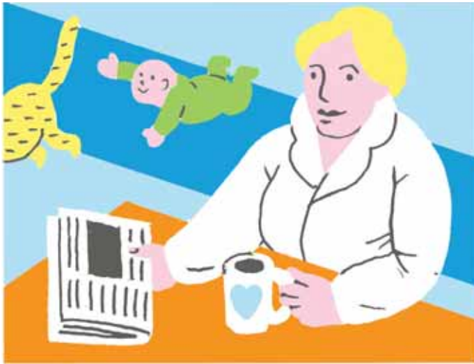
MYTHE 1 Moeders hebben het zwaar

lijdt of van ze scheidt, hebben ze weinig om op terug te vallen. Nederland telt bovendien, vergeleken met andere landen, abominabel weinig vrouwen in topposities. En hun aantal neemt nauwelijks toe.