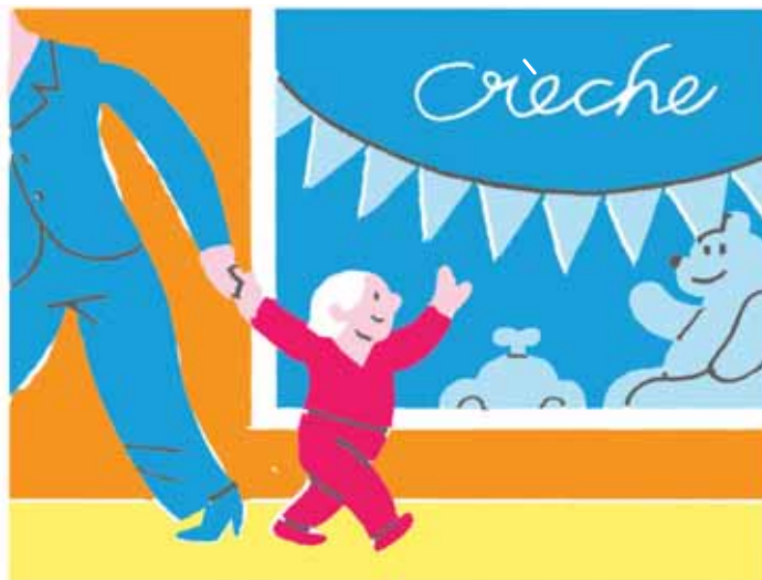
MYTHE 8 Kinderopvang is slecht geregeld in Nederland

Dat werken en kinderen bij vrouwen moeizaam samengaan, is ook niet juist. Natuurlijk is er een zekere spanning: in elk land werken meer mannen dan vrouwen. Vrouwen die de top bereiken, zijn vaker kinderloos dan mannen. En lang was het zo dat in landen waarin relatief veel vrouwen werkten, relatief weinig kinderen werden geboren. Sinds 1990 is het tegendeel het geval. In landen waarin veel vrouwen werken, blijken vrouwen nu ook meer kinderen te krijgen (zie 'Meer banen, meer baby's' op deze pagina). Nederland doet het in deze internationale vergelijking niet slecht: Nederlandse vrouwen werken redelijk veel en krijgen ook best veel kinderen.