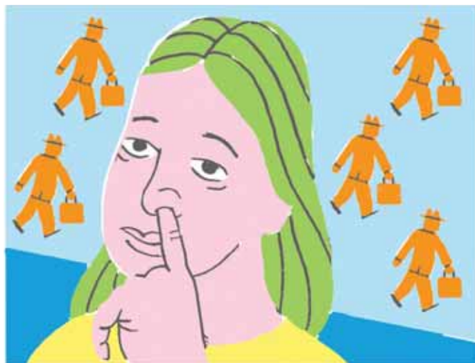
MYTHE 7 Nederlandse vrouwen hebben ambitie

en moederschap niet zijn te combineren. Daarom zouden jonge vrouwen steeds minder kinderen krijgen. Nog zo'n algemene aanname: Nederland heeft de oudste moeders ter wereld.